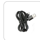
Cable de datos