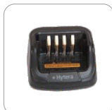
Cargador rápido MUC