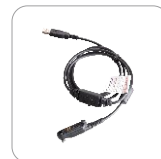
Cable de programación PC155