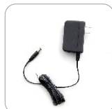
Adaptador de energía 12V/1 A