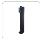
Clip para el cinturón