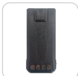
Batería de Li-Ion 1500 mAh